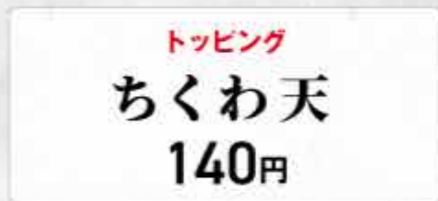
トッピング ちくわ天 140円