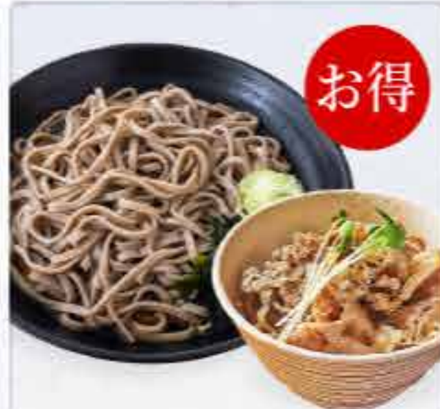
ミニ豚しゃぶ丼セット 冷 830円