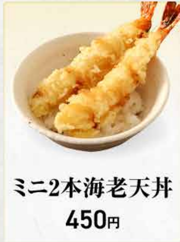
ミニ2本海老天丼 450円