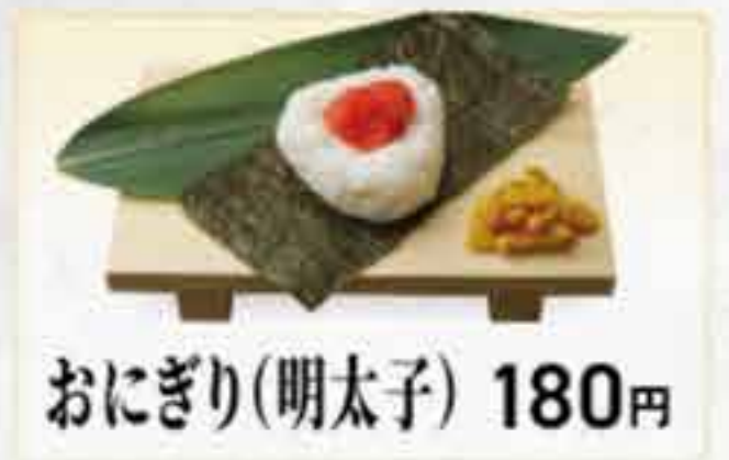
おにぎり(明太子) 180円