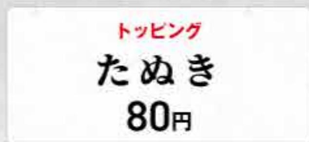
トッピング たぬき 80円