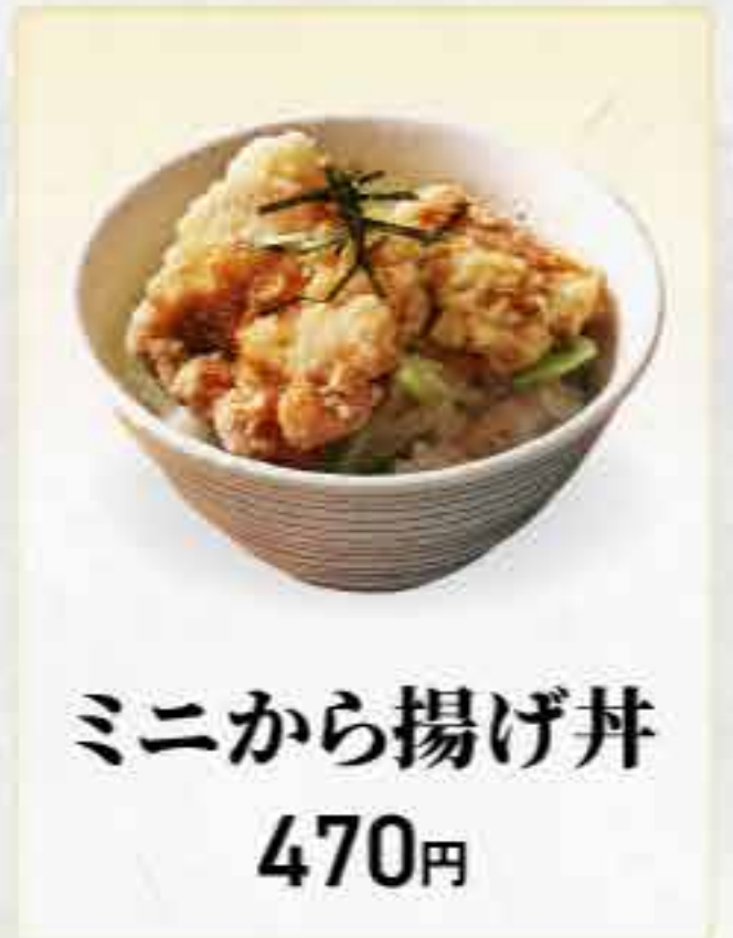
ミニから揚げ丼 470円