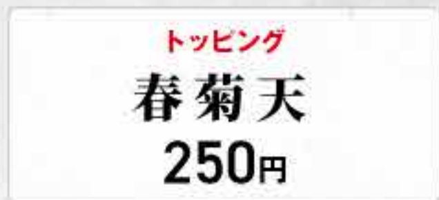
トッピング 春菊天 250円