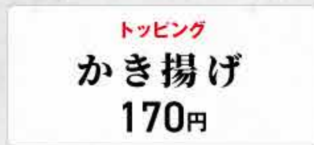
トッピング かき揚げ 170円