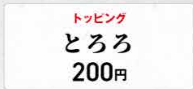
トッピング とろろ 200円