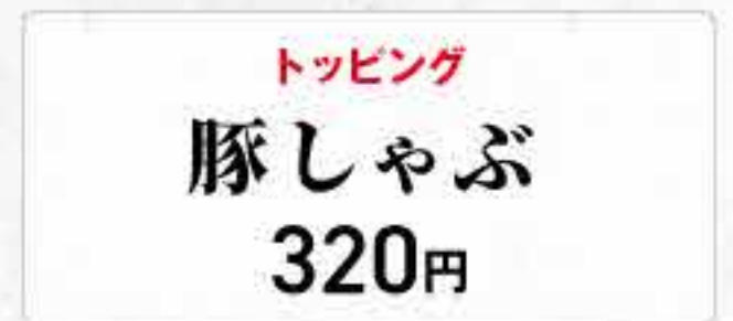
トッピング 豚しゃぶ 320円