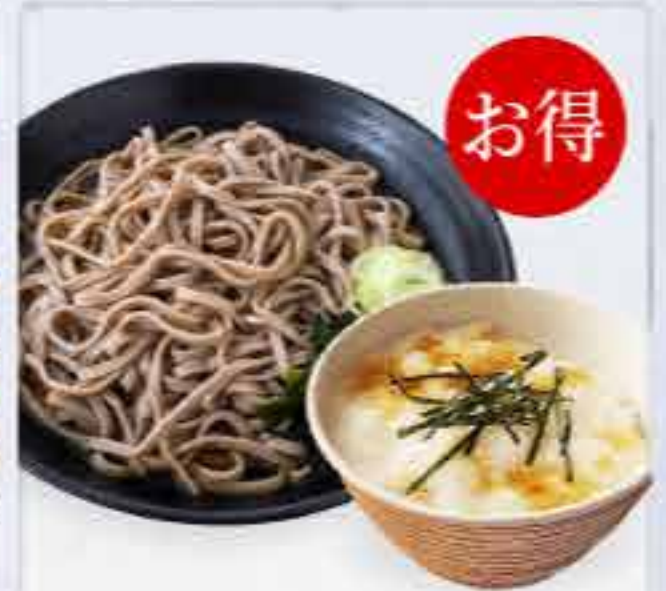
ミニとろろ丼セット 冷 730円