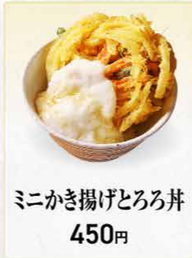
ミニかき揚げとろろ丼 450円