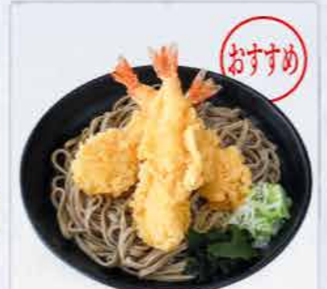
海老天3本 冷 1,030円