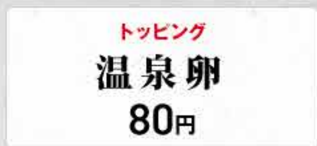
トッピング 温泉卵 80円