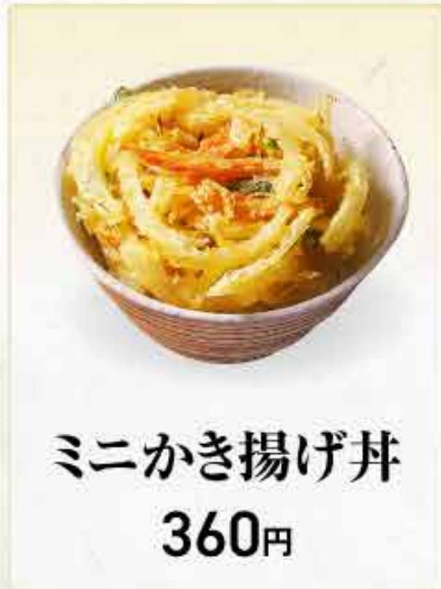
ミニかき揚げ丼 360円