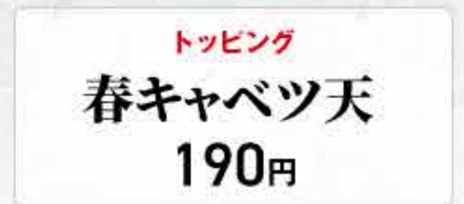
トッピング 春キャベツ天 190円