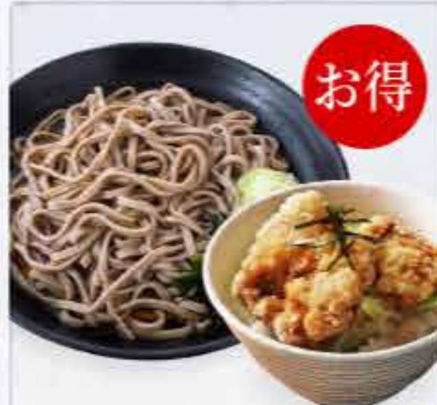
ミニ鶏から揚げ丼セット 冷 840円