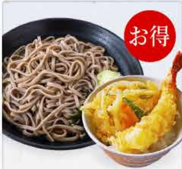
ミニ海老天丼セット 冷 830円