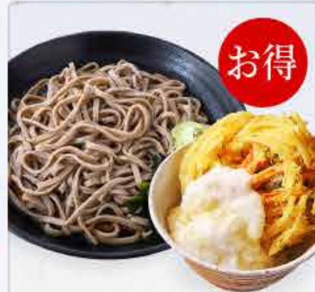
ミニかき揚げとろろ丼セット 冷 830円