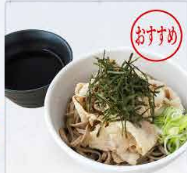
豚しゃぶつけ蕎麦 冷 750円