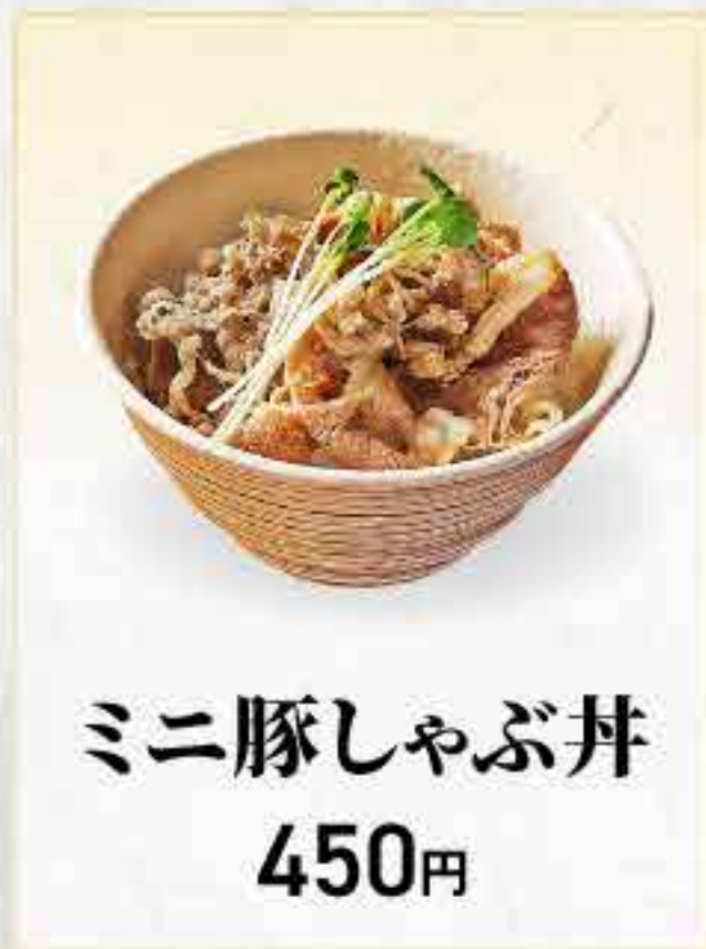
ミニ豚しゃぶ丼 450円