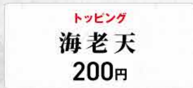
トッピング 海老天 200円