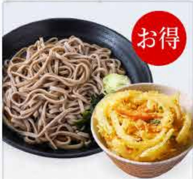
ミニかき揚げ丼セット 冷 730円