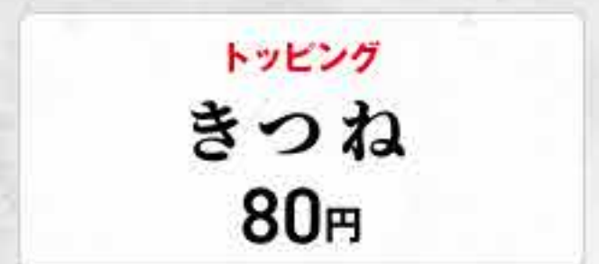
トッピング きつね 80円