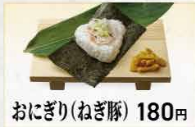
おにぎり(ねぎ豚) 180円